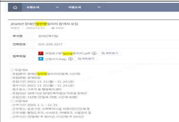
▶ 장애인 일자리 지원 보도자료 (2023.11.13)