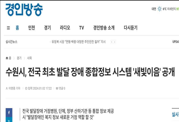
▶ 정보사이트 구축 「수원 iTV」(2023.12.28.)