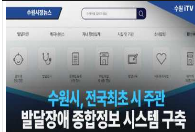
▶ 정보사이트 구축 「수원 유튜브」(2023.12.28.)