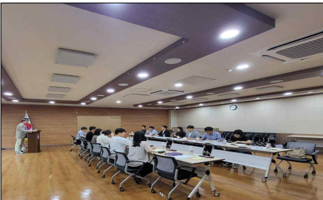
▶ 민·관 실무협의체 운영