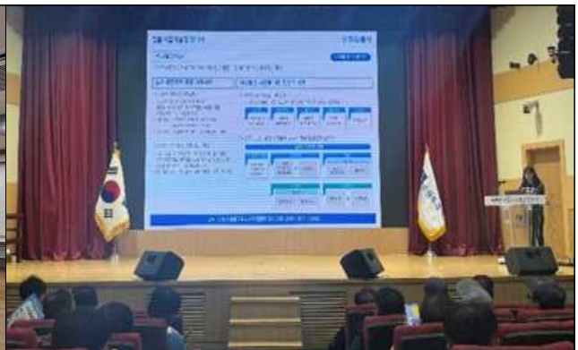
▶ 공동주택 리모델링 관련 교육 개최