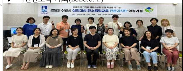
▶ 탄소중립교육 전문강사단 양성(2023.6.13, 13건)