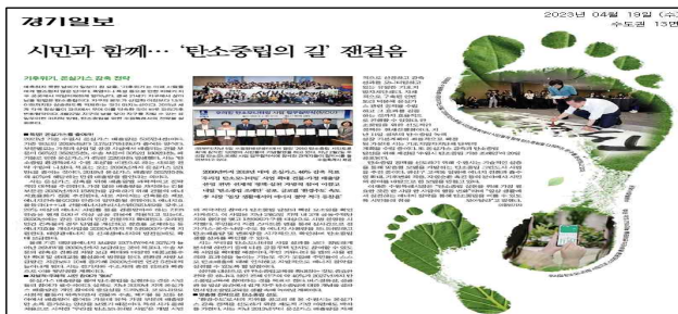
▶ 탄소중립 기획보도(2023.4.19, 30건)