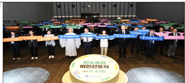
▶ 비전선포식 개최(2023.9.4.)