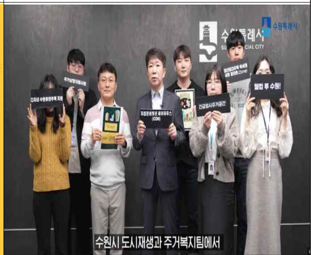
▶ 영상 - 2024년 주거복지 홍보영상 제작 - 2024년 시정 홍보영상 제작 수요조사 관련(홍보기획관)