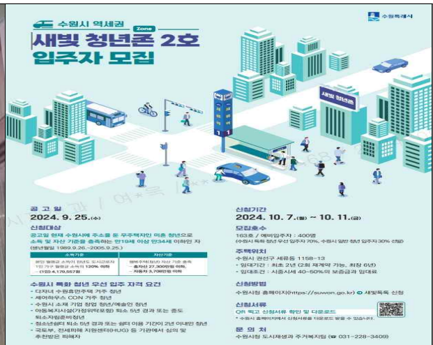
▶ 포스터 - 새빛 청년존(Zone) 2호 입주자 모집 - 홈페이지, 엘리베이터, 버스도착알리미(BIS) 표출