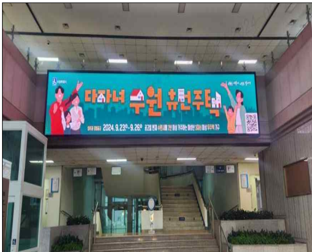
▶ 포스터 - '24년 다자녀 수원휴먼주택 입주자 모집 - 홈페이지, 엘리베이터, 버스도착알리미(BIS) 표출