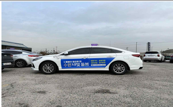
▶ 수원택시 래핑광고