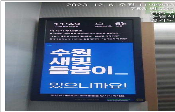
▶ 공동주택 엘리베이터 DID