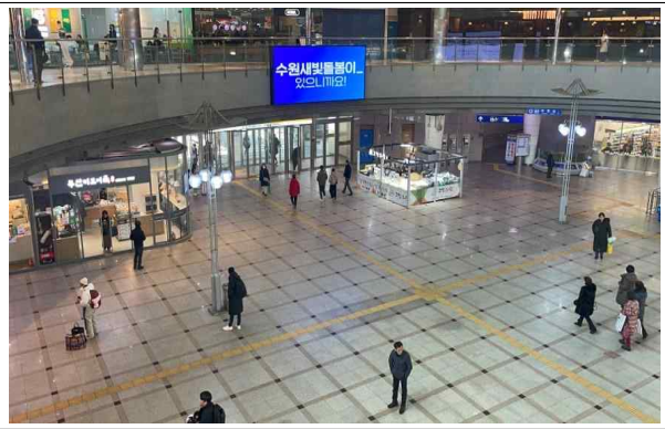
▶ 수원역 등 전광판 홍보 슷폼영상 송출