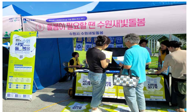
▶ 각종 행사 시 홍보부스 운영 (사회복지의 날, 주민자치박람회 등)