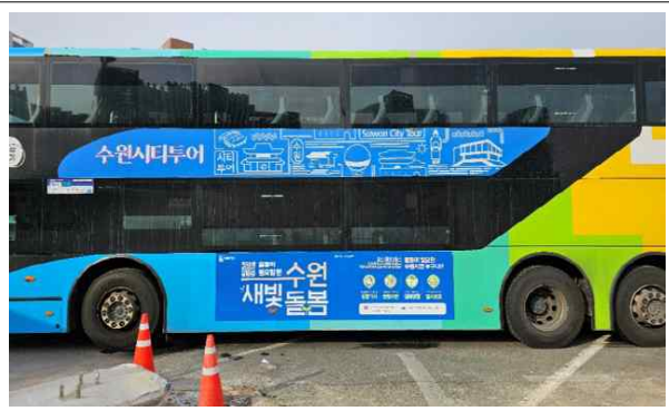
▶ 공공버스 래핑광고