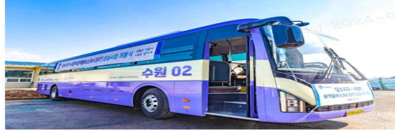
수원 당수-서울 사당 오가는 '광역 콜버스'

(수원=연암뉴스) 최준호 기자 = 경기 수원시는 당수지구와 서울 사당역을 오가는 광역 콜버스가 운영을 시작했다고 26일 밝혔다.