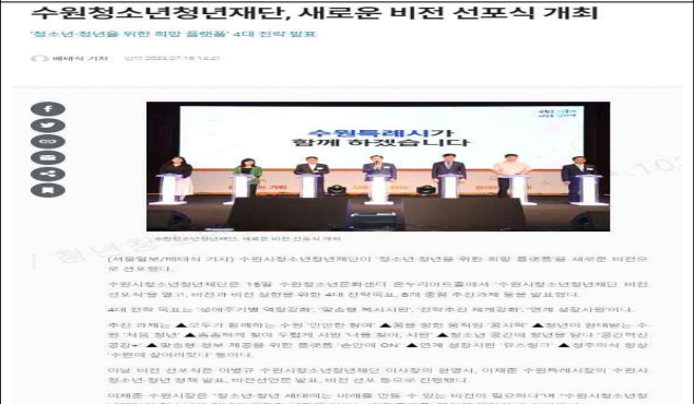
▶ '비전선포식' 보도자료(서울일보 2023.07.16.)