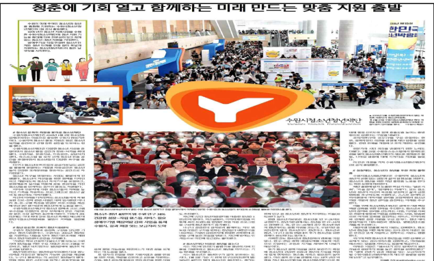
▶ '확대 개편' 보도자료(기호일보 2023.05.03.)