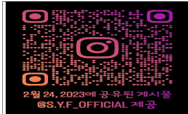
▶ '확대 개편' SNS 게시(인스타그램 2023. 2. 21.)