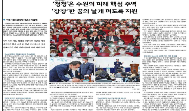
▶ '확대 개편' 보도자료(경기신문 2023.05.03.)