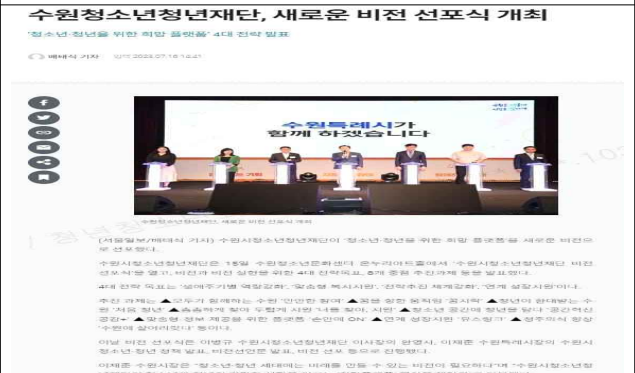
▶ '비전선포식' 보도자료(서울일보 2023.07.16.)