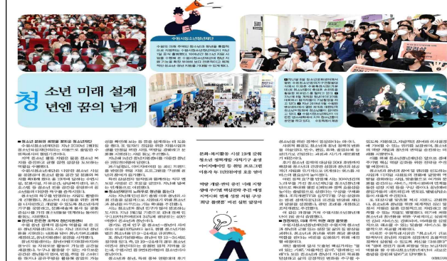
▶ '확대 개편' 보도자료(기호일보 2023.05.03.)