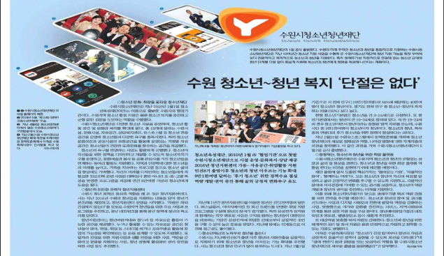
▶ '확대 개편' 보도자료(중부일보 2023.05.03.)