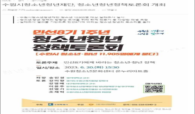
▶ '정책토론회' 보도자료(경인매일 2023.06.09.)