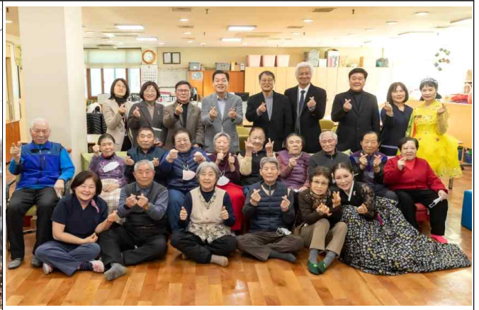
▶ 현장 방문 사진 (2025.02.13.)