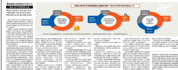
▶ 중부일보 여론조사 보도('25.3.11.)