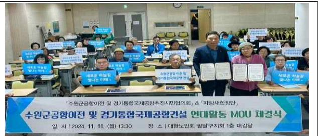
▶ 시민협의회 MOU 체결