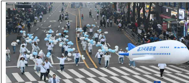
▶ 수원화성문화제 시민퍼레이드 참여 홍보 등('24.10.5~6.) 화성시민 62.9% “경기국제공항 지역경제에 도움될 것”