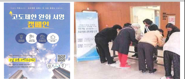
▶ 고도제한 완화 서명 캠페인 전개('24.12월~)