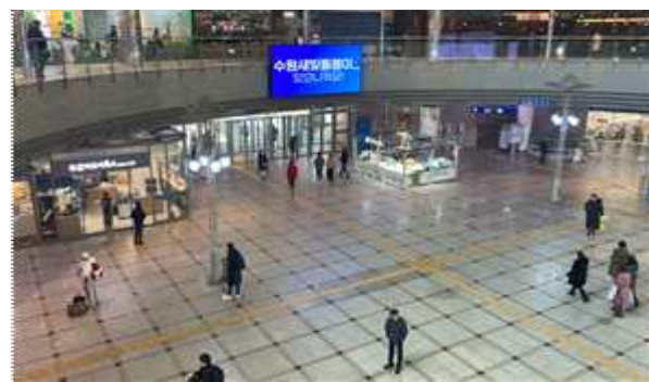
▶ 수원역 등 전광판 홍보 슷폼영상 송출