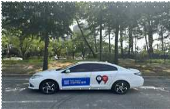
▶ 동·유관기관 차량 래핑