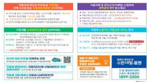
▶ 지방세 고지서 홍보