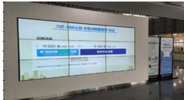
▶ 사구동 민원실, 박물관, 도서관 등 홍보영상 송출