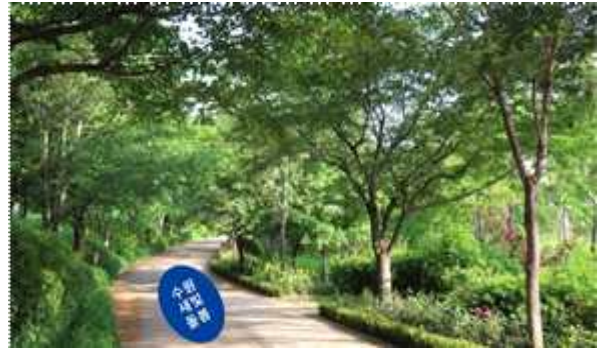
▶ 공원 등 바닥스티커(100cm×100cm)