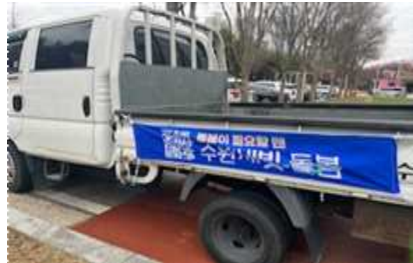
▶ 관용차량 홍보 현수막 게첨