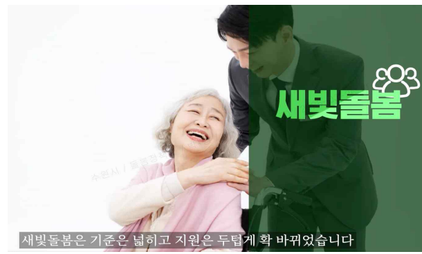
▶ 수원새빛돌봄 홍보영상 송출