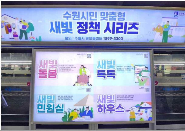
▶ 스크린도어 홍보(수원역)