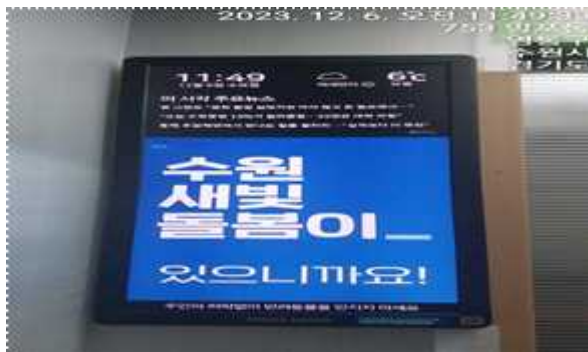
▶ 공동주택 엘리베이터 DID