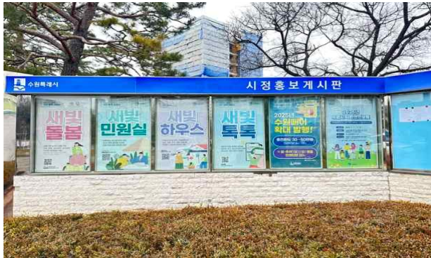
▶ 시청 게시판 게시 홍보

경도신문 2025년 03월 12일 (수) 지역 10면 '수원 새빛 돌봄' 서비스 제공기관 모집 수원시가 11일부터 21일까지 수원 '새빛 돌봄(누구나) 서비스' 신규 제공기관 4개소를 모집한다. 식사 지원, 일시 보호 서비스를 제공할 수 있는 지역 내 기관이 응모할 수 있다. ▲식사 지원(권선구·영봉구 배달 가능 업체 각 1개소) ▲식사 지원(특화, 당노식 제공) 1개소 ▲일시보호(1개소) 등 총 4개소를 모집한다. 시 홈페이지에서 공고문을 확인하고 신청서, 운영 계획서 등을 내려받아 작성한 후 시청 돌봄정책과에 방문제 제출해야 한다. 1차 내부 심사(정량 평가)와 2차 선정 심사 위원회(종합 평가) 심사를 거쳐 서비스 제공기관을 선정한다. 선정된 기관은 다음 달 21일부터 12월 31일까지 수원 새빛 돌봄(누구나) 서비스를 제공하게 된다. 김창식기자