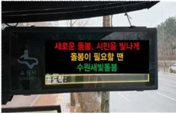
▶ BIS 버스도착알림이 홍보