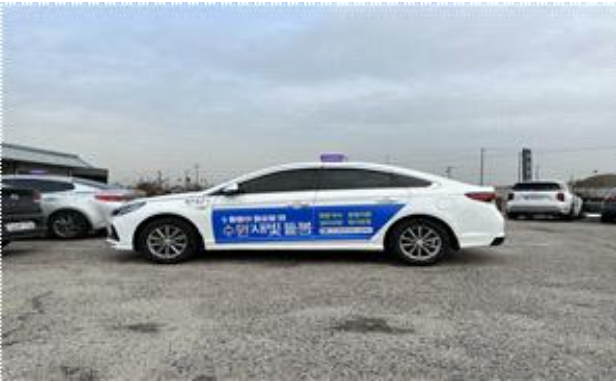
▶ 수원택시 래핑광고