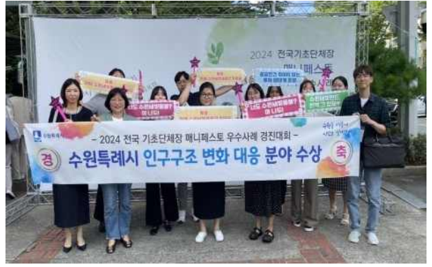
▶ 2024 매니페스토 “최우수상” 수상('24.7.31.)