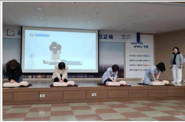
▶ 초등 등학교 동행돌봄 새빛돌보미 교육('25.5.29.)