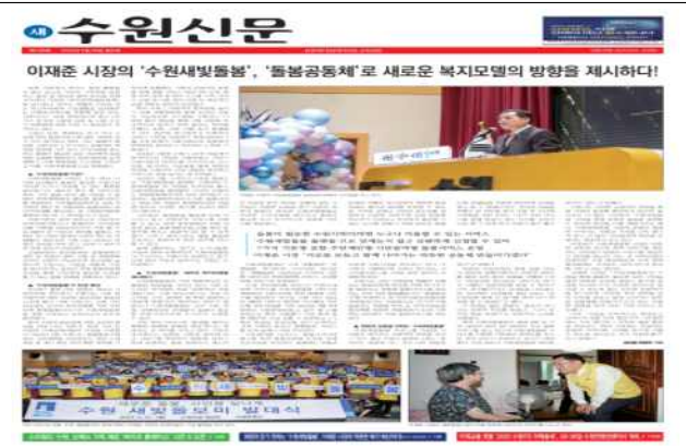
▶ 수원새빛돌봄 기획기사 보도(새로운수원)