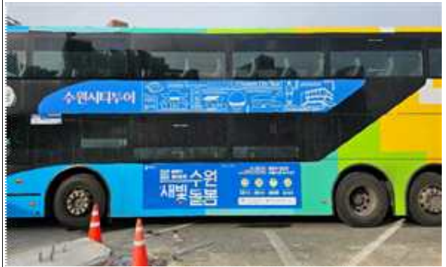
▶ 공공버스 래핑광고