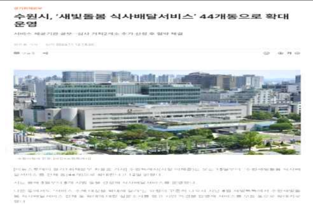
▶ 식사배달서비스 전동 확대 운영('24.11.12.)