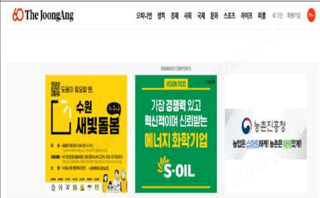
▶ 중앙일보 등 인터넷 배너 홍보(27개 매체)