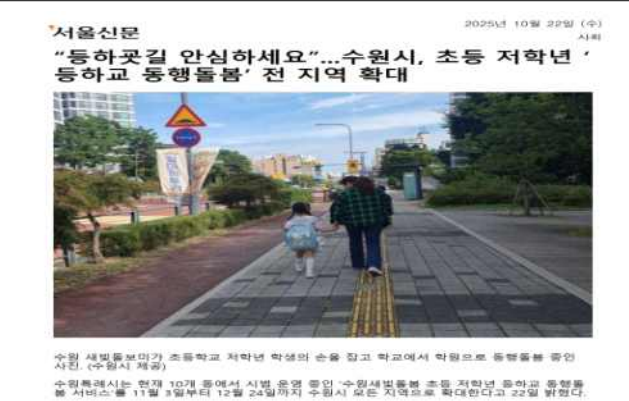
▶ 초등 저학년 등하교 동행돌봄 전동확대