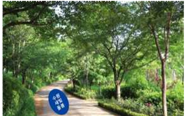
▶ 공원 등 바닥스티커(100cm×100cm)