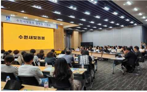
▶ 수원새빛돌봄 플랫폼 시연회('24.6.24.)