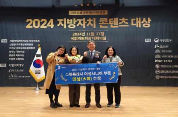
▶ 지방자치콘텐츠대상 “대상” 수상('24.11.27.)