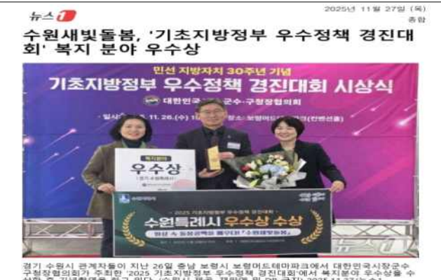
▶ 기초지방정부 우수정책 '우수상' 수상(25.11.26.)