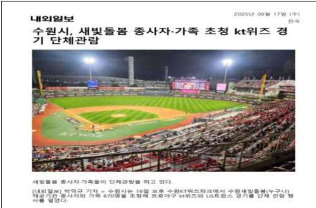
▶ 제공기관 중사자 힐링 프로그램(25.9.16)