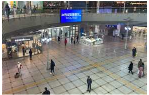
▶ 수원역 등 전광판 홍보 슷폼영상 송출