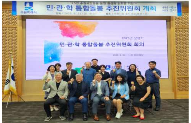
▶ 민관학 통합돌봄 추진위원회 개최('25.6.23.)