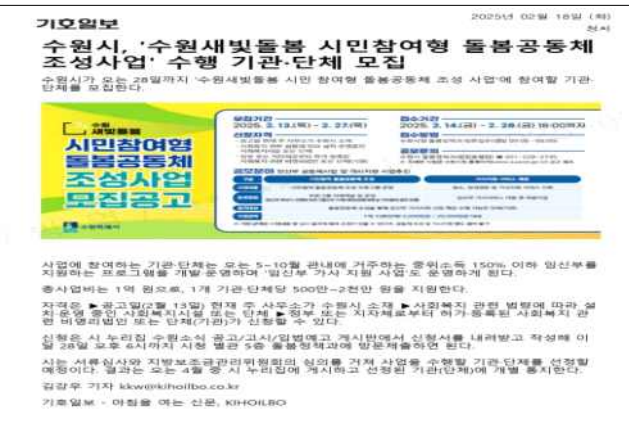
▶ 시민참여형 공모사업('25.2.18.)