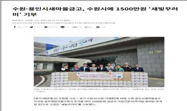
▶ 추석맞이 새빛꾸러미 나눔 전달식(25.9.18.)