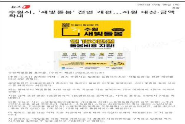
▶ 2025년 수원새빛돌봄 확대운영(연합뉴스 등 30건)