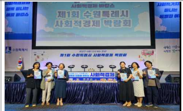
▶ 사회적경제박람회 수원새빛돌봄 발표('25.7.29.)