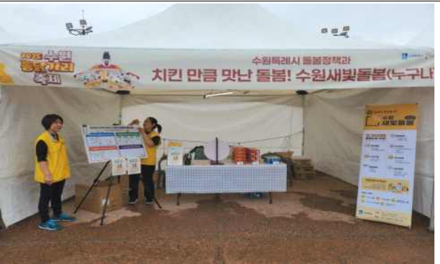
▶ 수원통닭거리 축제 홍보부스 운영(25.9.19.)