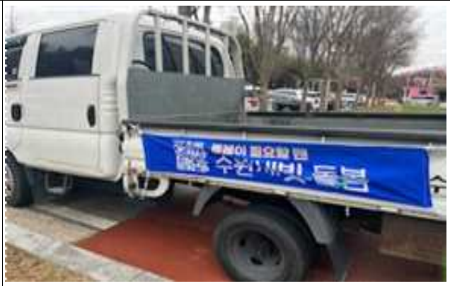
▶ 관용차량 홍보 현수막 게시