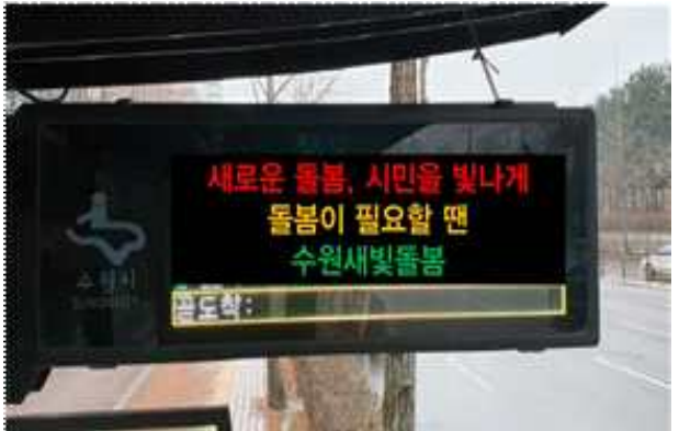
▶ BIS 버스도착알림이 홍보