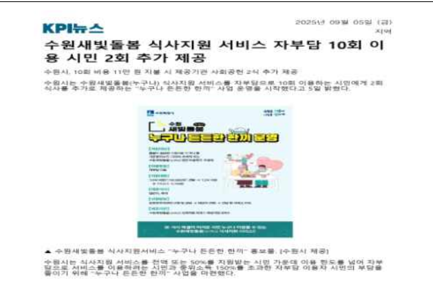
▶ 누구나 든든한 한끼 사업 안내(25.9.4.)