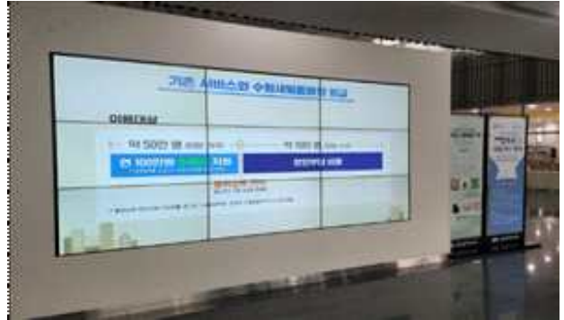
▶ 사구동 민원실, 박물관, 도서관 등 홍보영상 송출