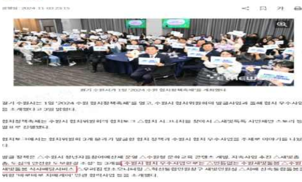
▶ 민·관협치 정책 우수사례 발표('24.11.3.)