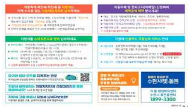
▶ 지방세 고지서 홍보