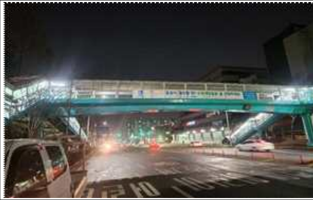
▶ 육교 현판 설치