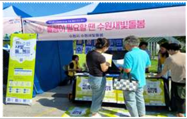
▶ 홍보부스 운영(사회복지의 날, 주민자치박람회 등)