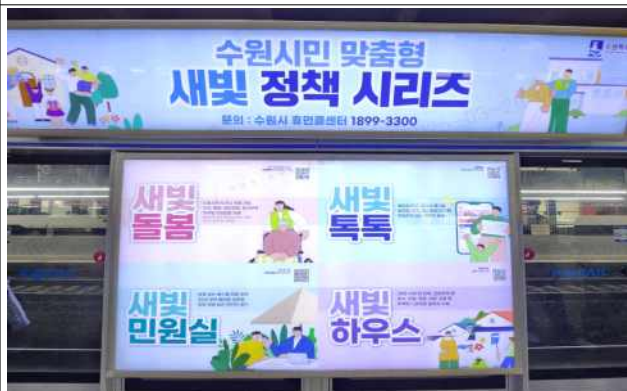
▶ 스크린도어 홍보(수원역)