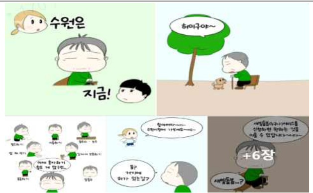
▶ 수원새빛돌봄 일러스트 홍보