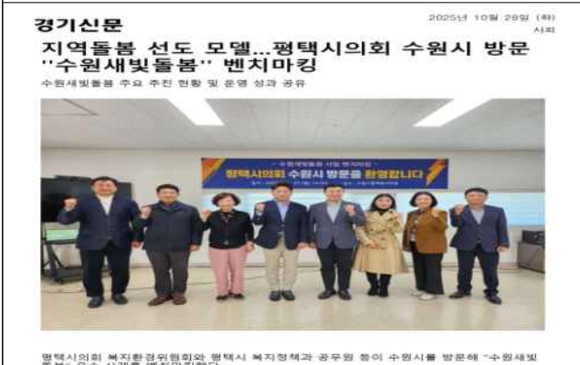
▶ 평택시의회 복지환경위원회 벤치마킹(25.10.27.)