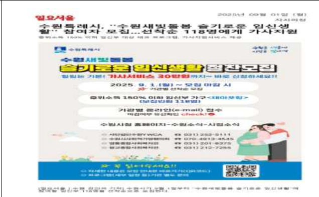
▶ 슬기로운 임신생활 신청자 모집('25.9.1.)