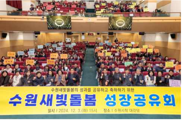
▶ 수원새빛돌봄 성장공유회 개최('24.12.3.)