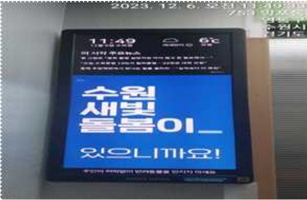
▶ 공동주택 엘리베이터 DID