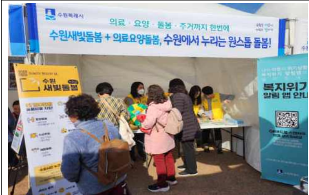
▶ 노인일자리 채용한마당 홍보부스 운영(25.11.11.)