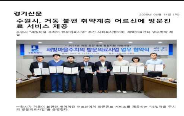
▶ 방문의료서비스 지정 및 협약('25.8.13.)