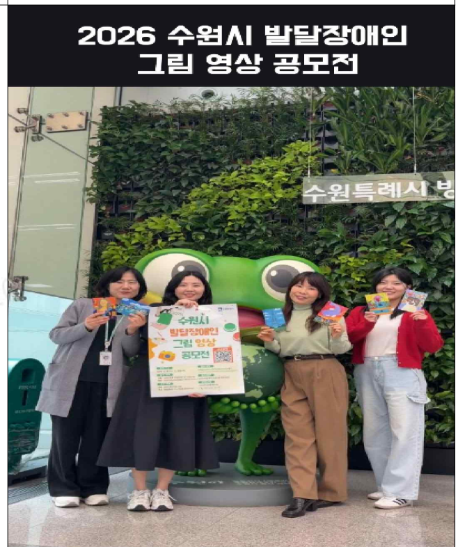
▶ 발달장애인 그림영상 공모전 홍보 SNS (2026.3.16.)