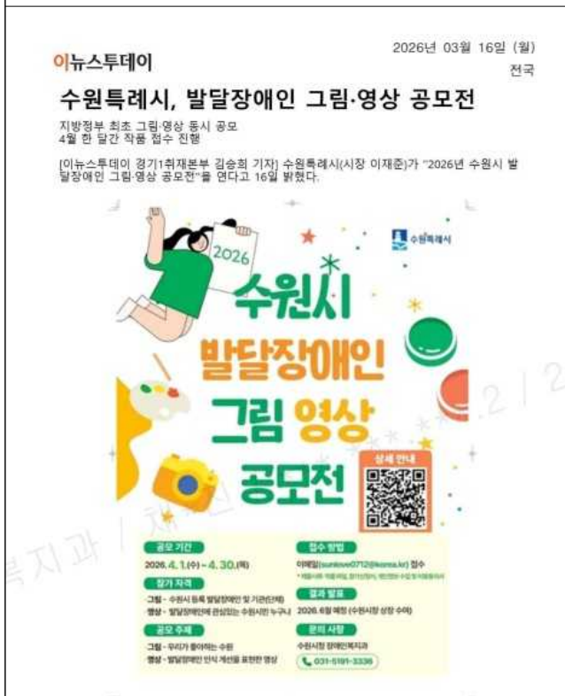
▶ 발달장애인 그림영상 공모전 홍보 보도자료 게재 (2026.3.16.)