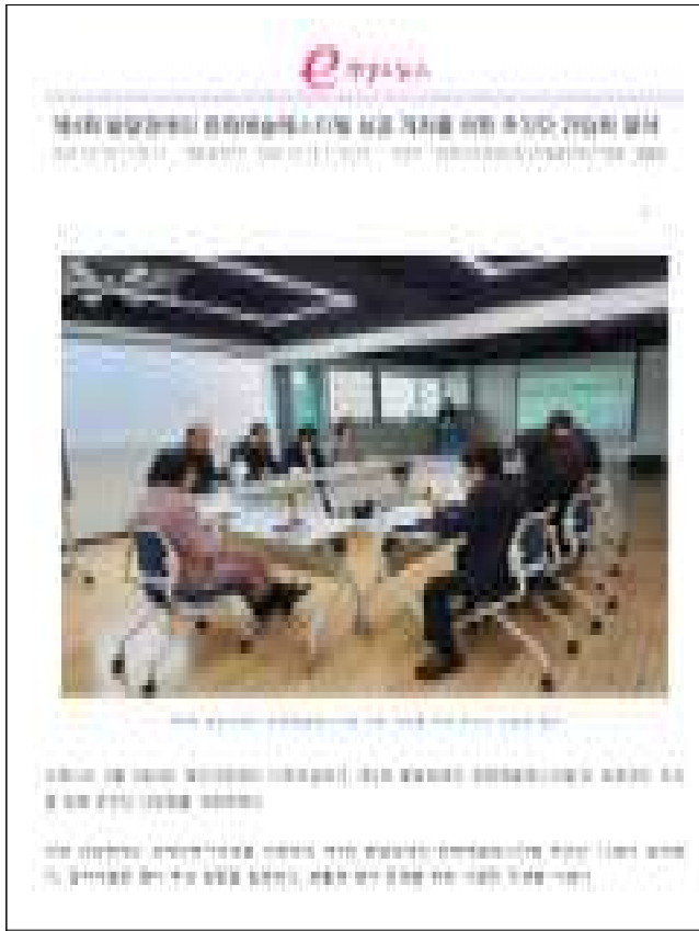
▶ 발달장애 소통채널 추진단 간담회 보도자료 게시(2026.3.6.)