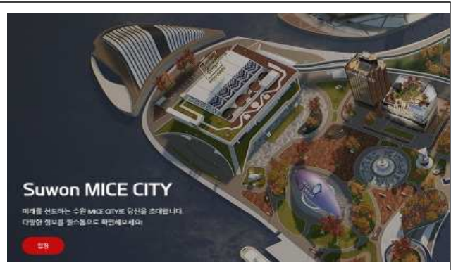
▶ 수원컨벤션센터 홈페이지_수원 MICE CITY(VR)