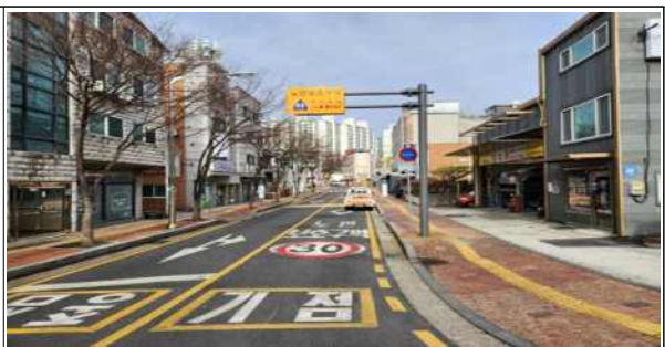
금당골 경로당 앞 노인 보호구역