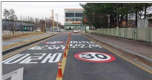
오현초등학교 앞 어린이 보호구역