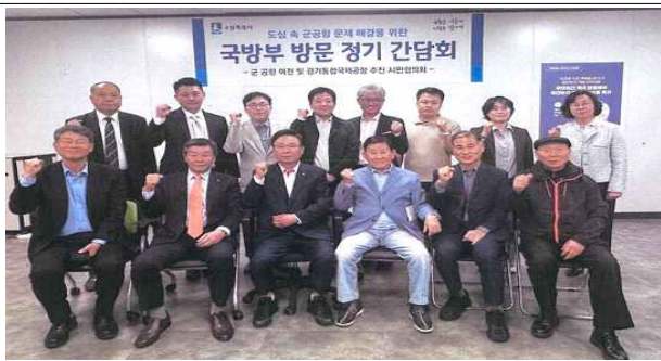
▶시민협의회-국방부, 간담회 개최('25.4.28.)