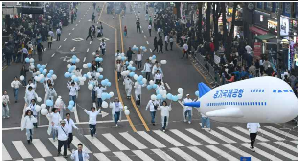
▶수원화성문화제 시민퍼레이드 참여 홍보 등('24.10.5.~6.)