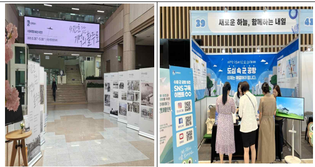
▶수원비행장 80년 사진전 및 홍보부스('25.5.26.~9.20.)