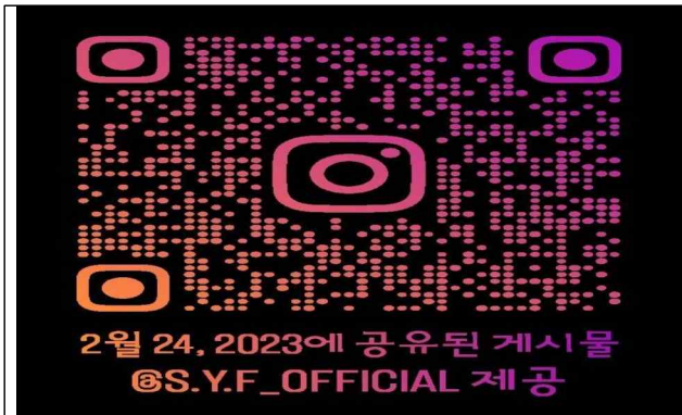
▶ '확대 개편' SNS 게시(인스타그램 2023. 2. 21.)