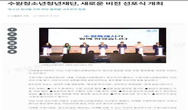
▶ '비전선포식' 보도자료(서울일보 2023.07.16.)