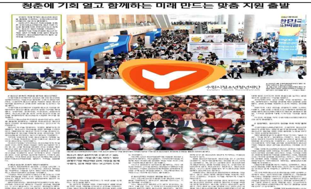
▶ '확대 개편' 보도자료(기호일보 2023.05.03.)