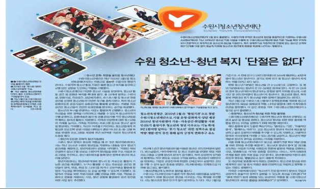
▶ '확대 개편' 보도자료(중부일보 2023.05.03.)