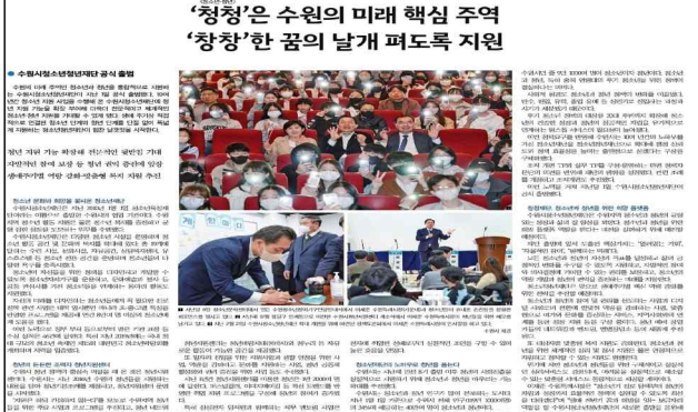
▶ '확대 개편' 보도자료(경기신문 2023.05.03.)