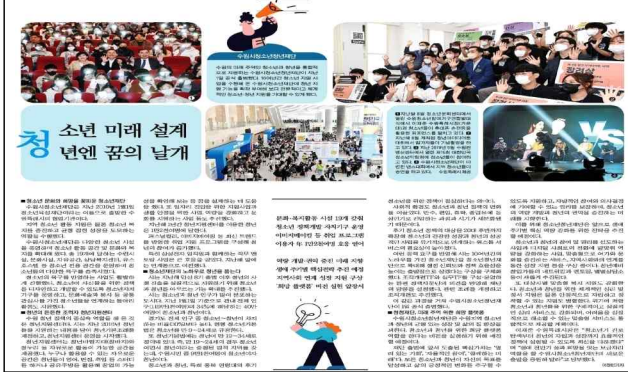
▶ '확대 개편' 보도자료(기호일보 2023.05.03.)