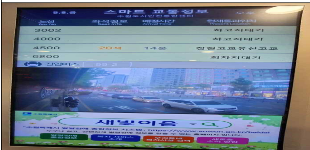
▶ 버스도착알림이(BIS) 새빛이음 홍보(2026.5.8.)