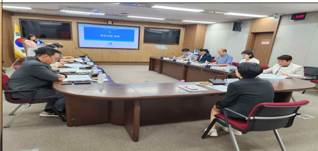
▶ 발달장애 소통채널 추진단 회의(2026.6.9.)