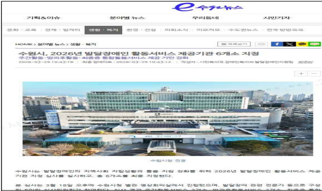
▶ 발달장애인 활동서비스 제공기관 지정 보도자료(2026.3.25.)