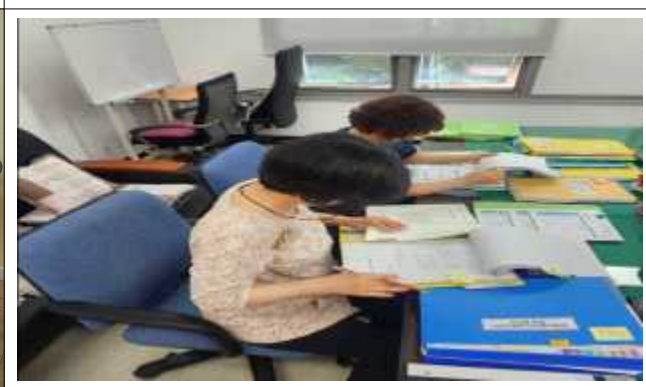
▶ 장애인복지일자리사업 수행기관 지도점검(2025.06.16.)