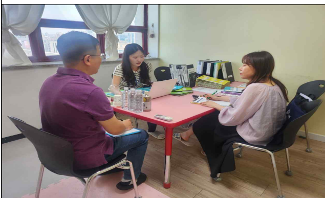
▶ 주간 방과후 활동서비스 모니터링 실시(2026.6.15.)