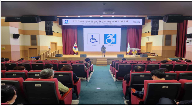
▶ 장애인일번형일자리 기본교육 실시(2026.3.23.)