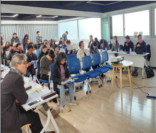
▶ 토크콘서트 개최 (2025.02.)