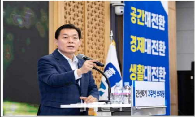
▶ 보도자료 배포 (2024.09.)

9월 25일부터 내년 4월 30일까지 정비구역 지정 접수 토지 등 소유자 50% 이상 구역 지정 희망 지역 또는 시각사가 토지 등 소유자 3분의 2 이상 동의한 지역 대상 [수원=이대일 기자] 수원특례시가 주민들로부터 주택 재개발·재건축 정비구역 제안을 접수한다. 앞서 수원시는 최소 5년에서 10년까지 걸리던 신규 정비구역 지정기간을 2년으로 단축하기 위해 주민이 재개발·재건축 정비사업을 주도하는 '정비구역 주민제안 방식'을 도입했다.