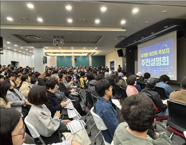
후보지 선정 네이버 홍보 (2025.10.)