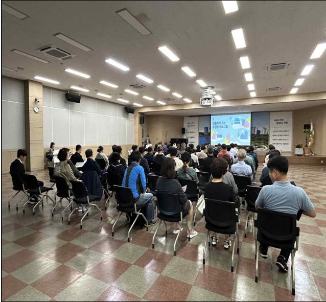
▶ 주민설명회 개최 (2024.10.)