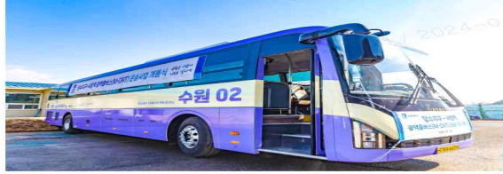
수원 당수-서울 사당 오가는 '광역콜버스' [수원시 제공. 재판매 및 DB 금지]

(수원-연말뉴스) 최준호 기자 = 경기 수원시는 당수지구와 서울 사당역을 오가는 광역 콜버스가 운영을 시작했다고 26일 밝혔다.