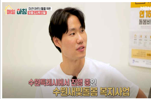
▶ MBN '트롯 가수 신성의 신성한 알바'(25.6.12.)