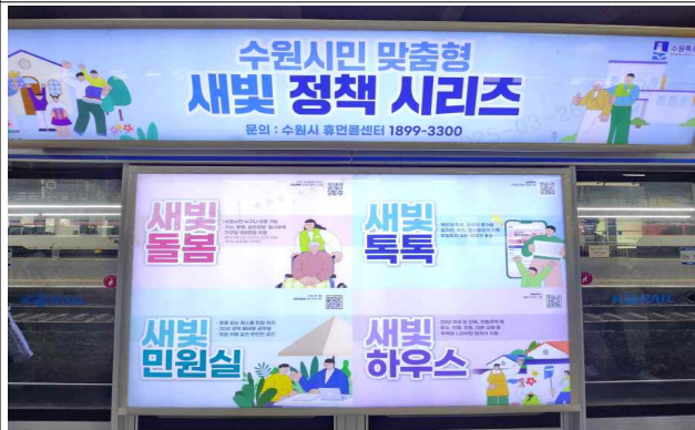
▶ 스크린도어 홍보(수원역)