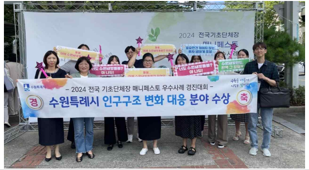
▶ 2024 매니페스토 “최우수상” 수상('24.7.31.)