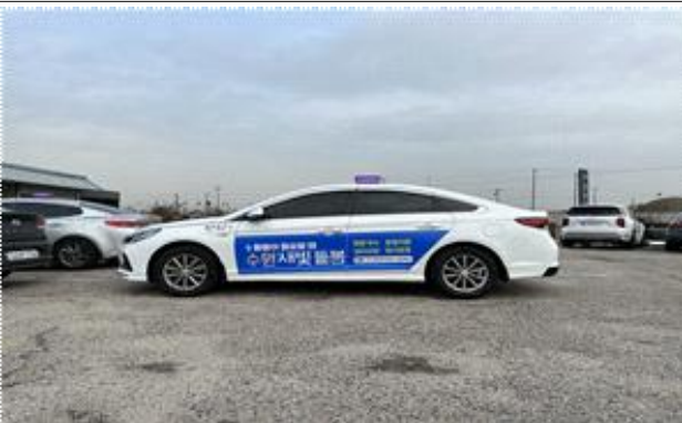
▶ 수원택시 래핑광고