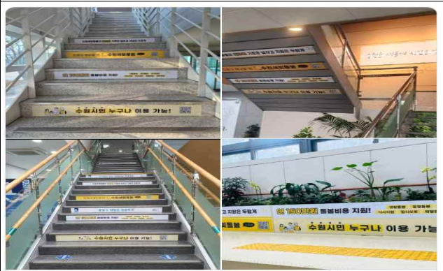
▶ 청사 계단 홍보스티커 부착(4개구, 44개동)