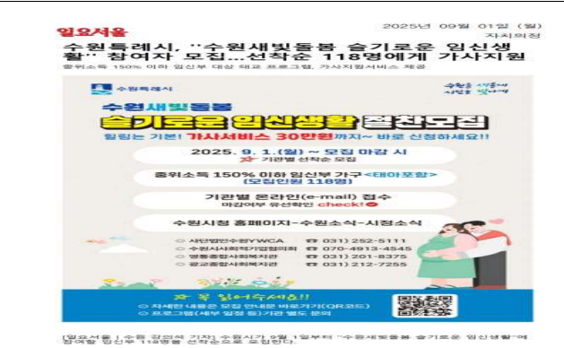
▶ 슬기로운 임신생활 신청자 모집(25.9.1.)