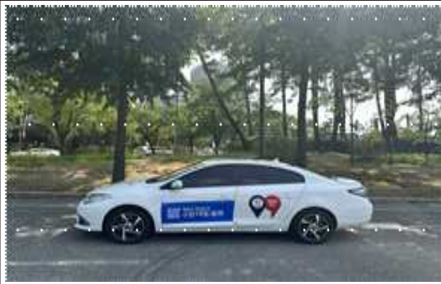
▶ 동·유관기관 차량 래핑