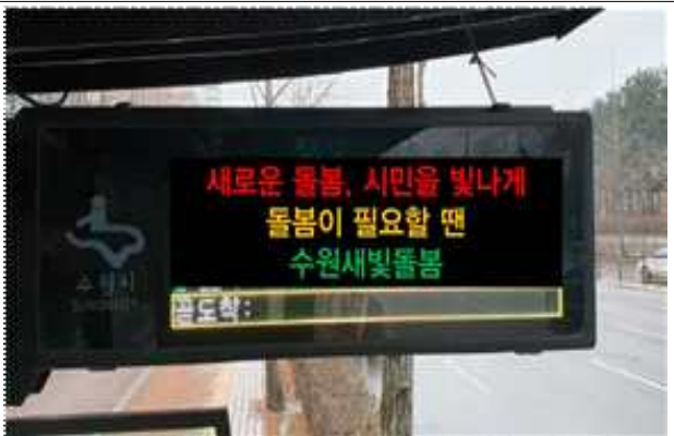
▶ BIS 버스도착알림이 홍보