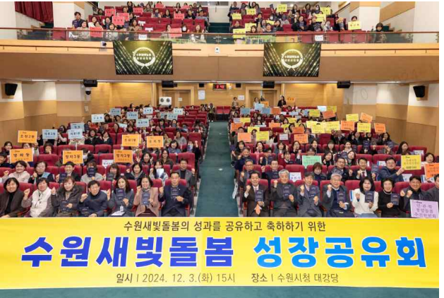
▶ 수원새빛돌봄 성장공유회 개최('24.12.3.)