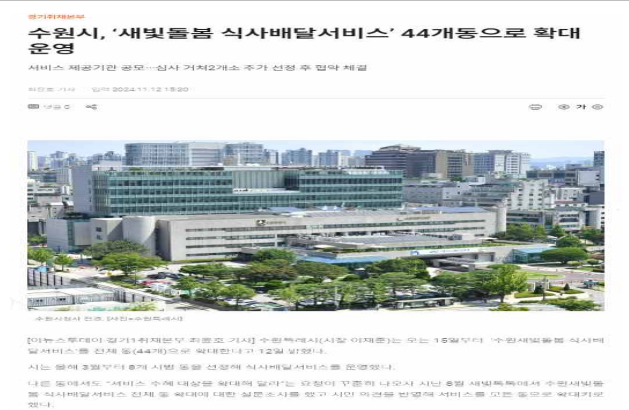
▶ 식사배달서비스 전동 확대 운영('24.11.12.)