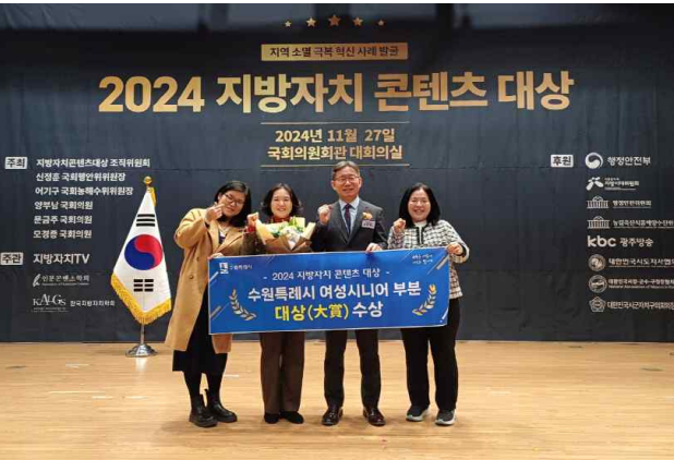
▶ 지방자치콘텐츠대상 “대상” 수상('24.11.27.)