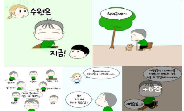
▶ 수원새빛돌봄 일러스트 홍보