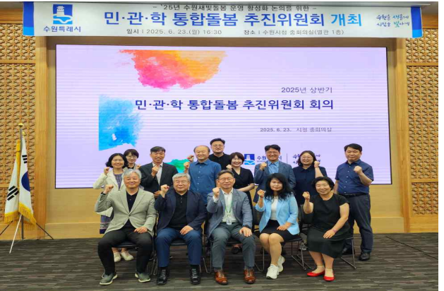
▶ 민관학 통합돌봄 추진위원회 개최(25.6.23.)