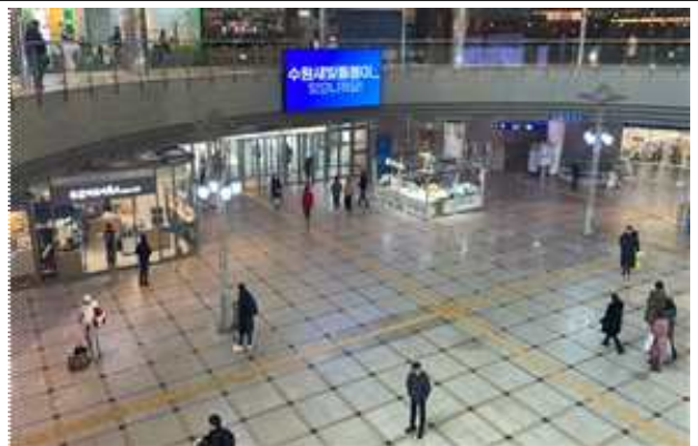
▶ 수원역 등 전광판 홍보 슷폼영상 송출