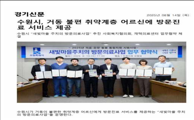
▶ 방문의료서비스 지정 및 협약(25.8.13.)