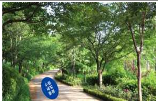
▶ 공원 등 바닥스티커(100cm×100cm)