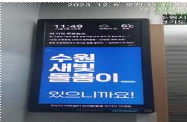
▶ 공동주택 엘리베이터 DID