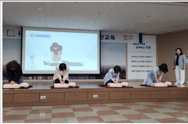
▶ 초등 등학교 동행돌봄 새빛돌봄이 교육(25.5.29.)