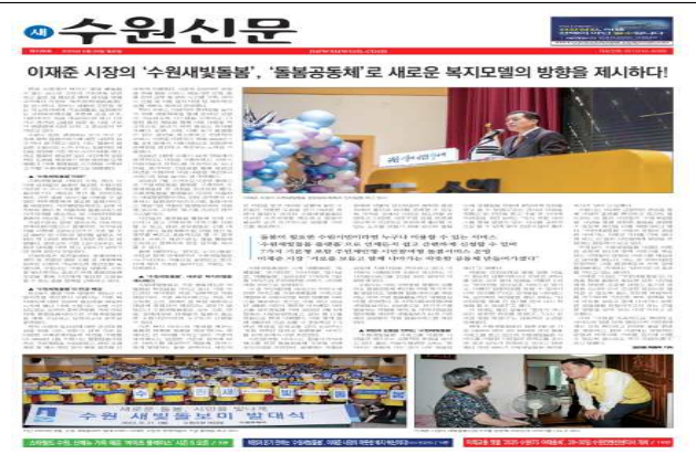
▶ 수원새빛돌봄 기획기사 보도(새로운수원)