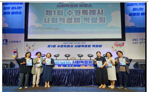
▶ 사회적경제박람회 수원새빛돌봄 발표(25.7.29.)