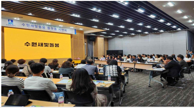
▶ 수원새빛돌봄 플랫폼 시연회('24.6.24.)