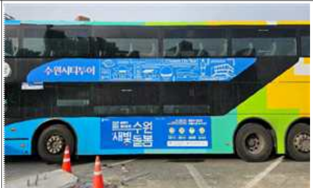
▶ 공공버스 래핑광고